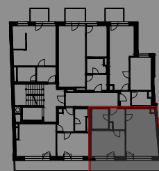
UMÍSTĚNÍ JEDNOTKY V PŮDORYSU