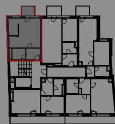
UMÍSTĚNÍ BYTU V PŮDORYSU