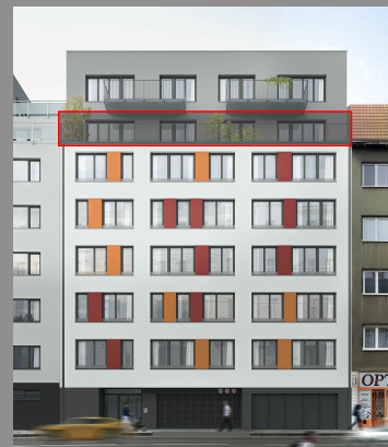
OZNAČENÍ PODLAŽÍ VE VIZUALIZACI